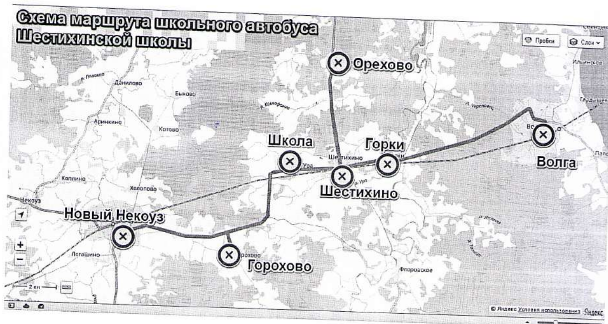
Схема маршрута школьного автобуса