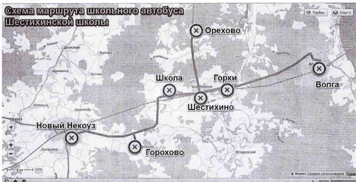
Схема маршрута школьного автобуса